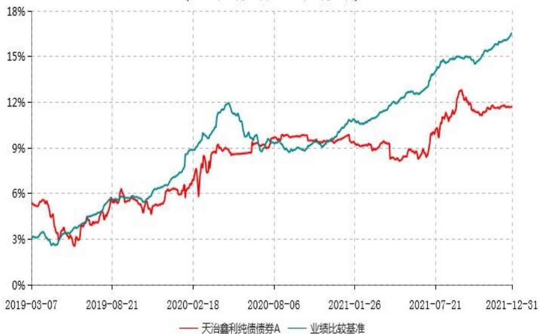
天治鑫利纯债债券A累计净值增长率与业绩比较基准收益率历史走势对比图 (2019年03月07日-2021年12月31日)