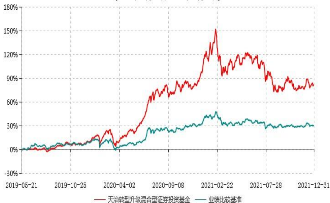
天治转型升级混合型证券投资基金累计净值增长率与业绩比较基准收益率历史走势对比图 (2019年05月21日-2021年12月31日)