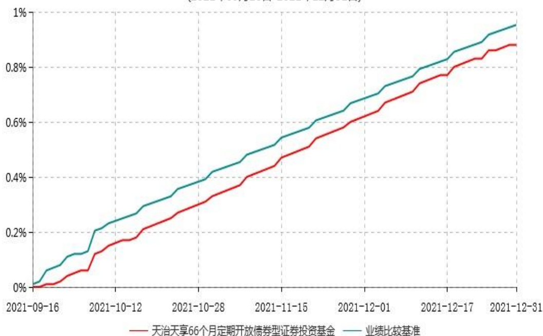
天治天享66个月定期开放债券型证券投资基金累计净值增长率与业绩比较基准收益率历史走势对比图 (2021年09月16日-2021年12月31日)