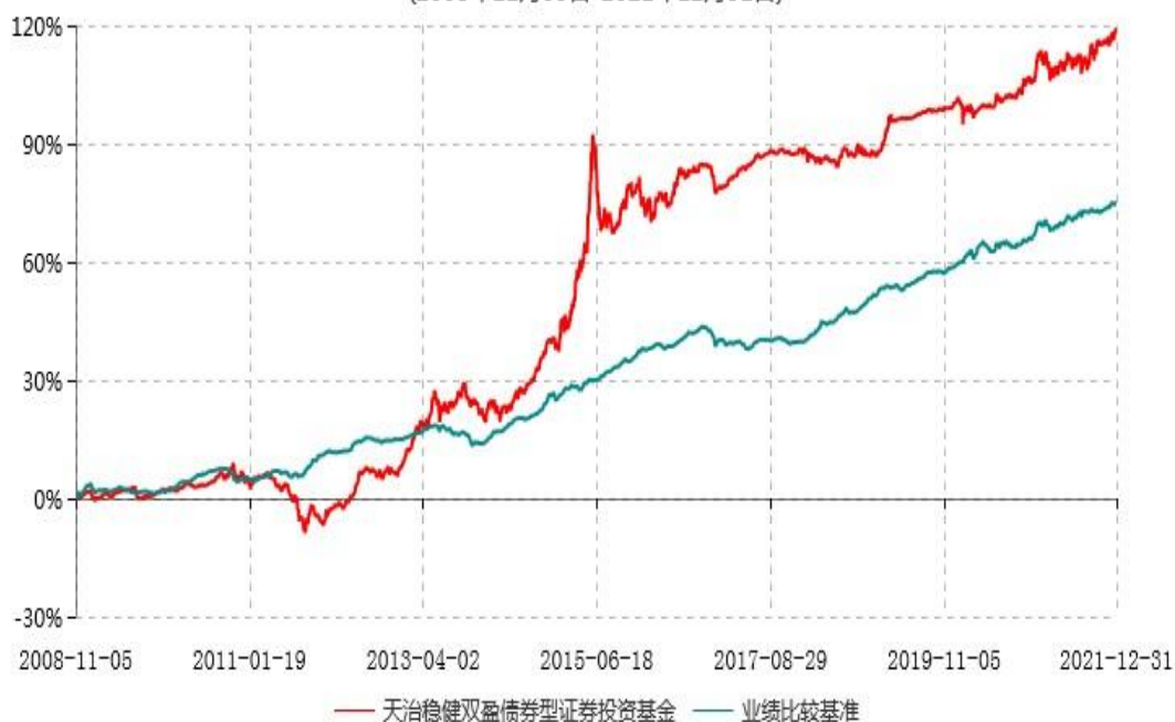
天治稳健双盈债券型证券投资基金累计净值增长率与业绩比较基准收益率历史走势对比图 (2008年11月05日-2021年12月31日)