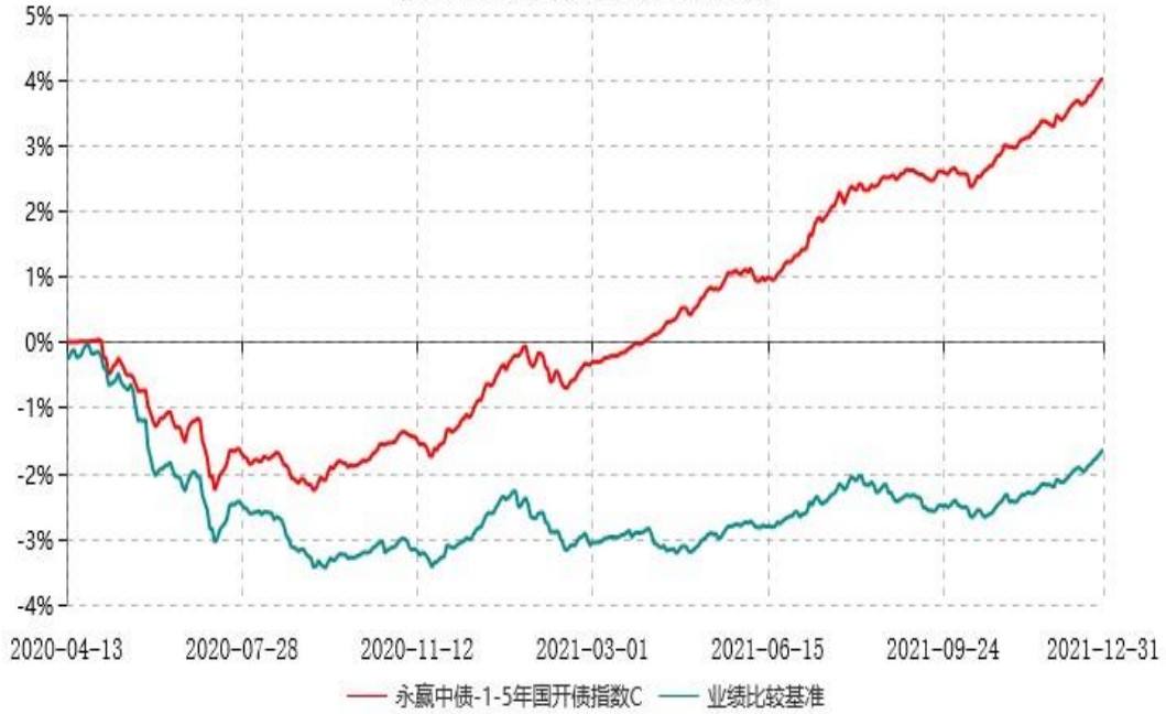
永赢中债-1-5年国开债指数C累计净值增长率与业绩比较基准收益率历史走势对比图 (2020年04月13日-2021年12月31日)