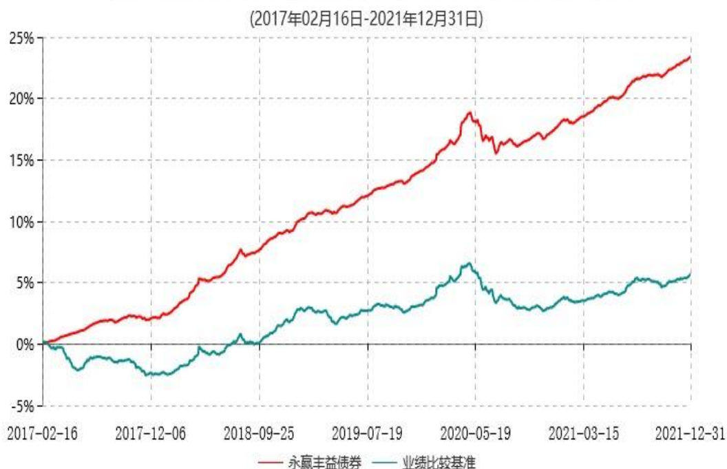
永赢丰益债券型证券投资基金累计净值增长率与业绩比较基准收益率历史走势对比图