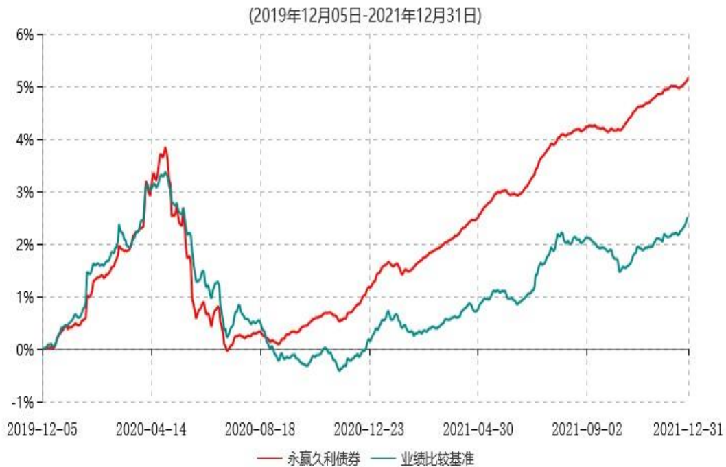
永赢久利债券型证券投资基金累计净值增长率与业绩比较基准收益率历史走势对比图