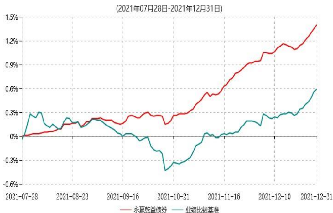
永赢乾益债券型证券投资基金累计净值增长率与业绩比较基准收益率历史走势对比图

注：1、本基金合同生效日为2021年7月28日，截至本报告期末本基金合同生效未满一年； 2、本基金建仓期为本基金合同生效日起六个月，截至本报告期末，本基金尚处于建仓期中。