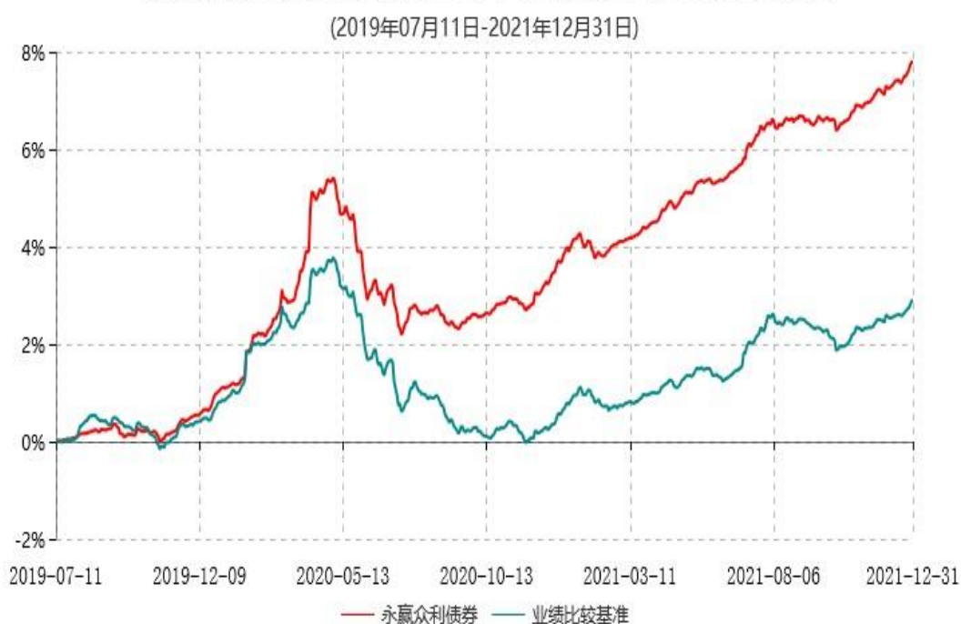
永赢众利债券型证券投资基金累计净值增长率与业绩比较基准收益率历史走势对比图