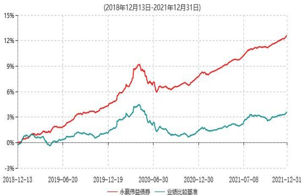
永赢伟益债券型证券投资基金累计净值增长率与业绩比较基准收益率历史走势对比图