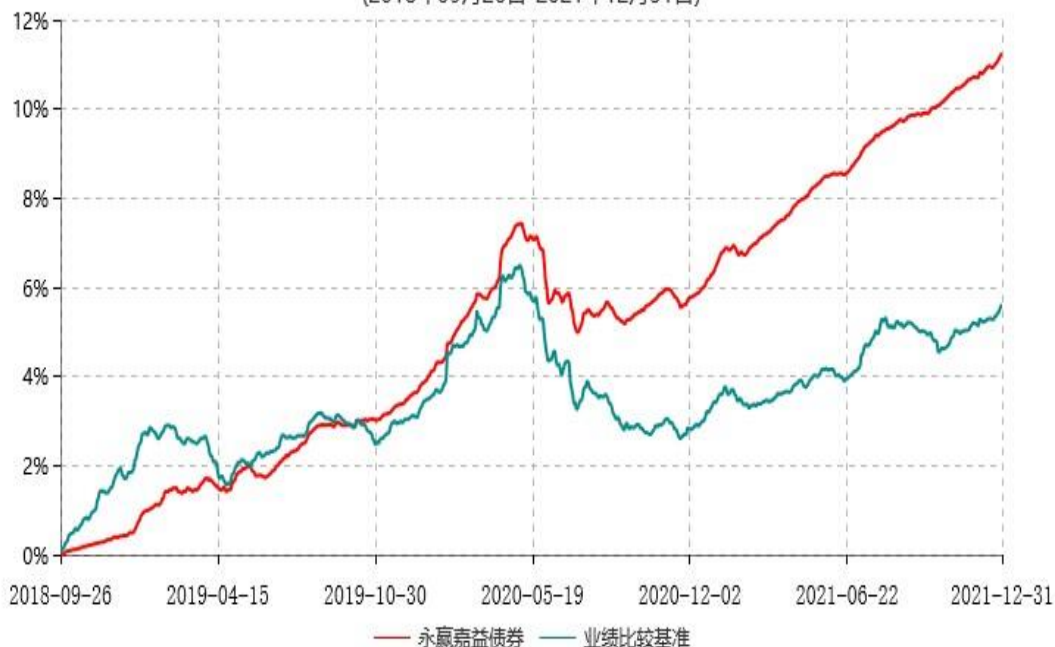
永赢嘉益债券型证券投资基金累计净值增长率与业绩比较基准收益率历史走势对比图 (2018年09月26日-2021年12月31日)