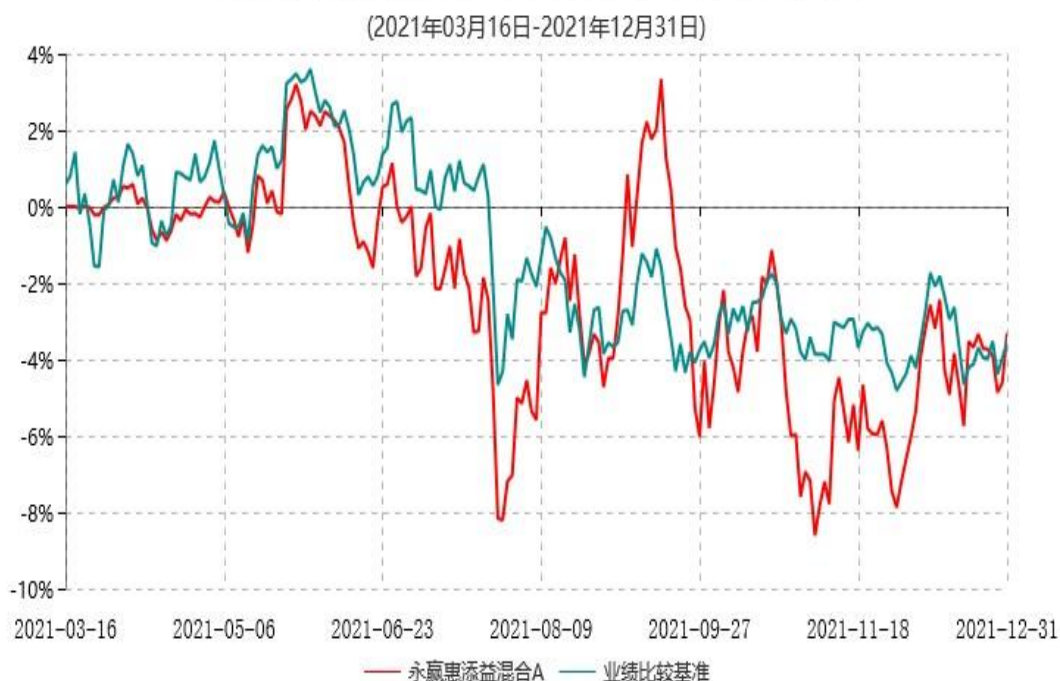
永赢惠添益混合A累计净值增长率与业绩比较基准收益率历史走势对比图

注：1、本基金合同生效日为 2021 年 03 月 16 日，截至本报告期末本基金合同生效未满一年；