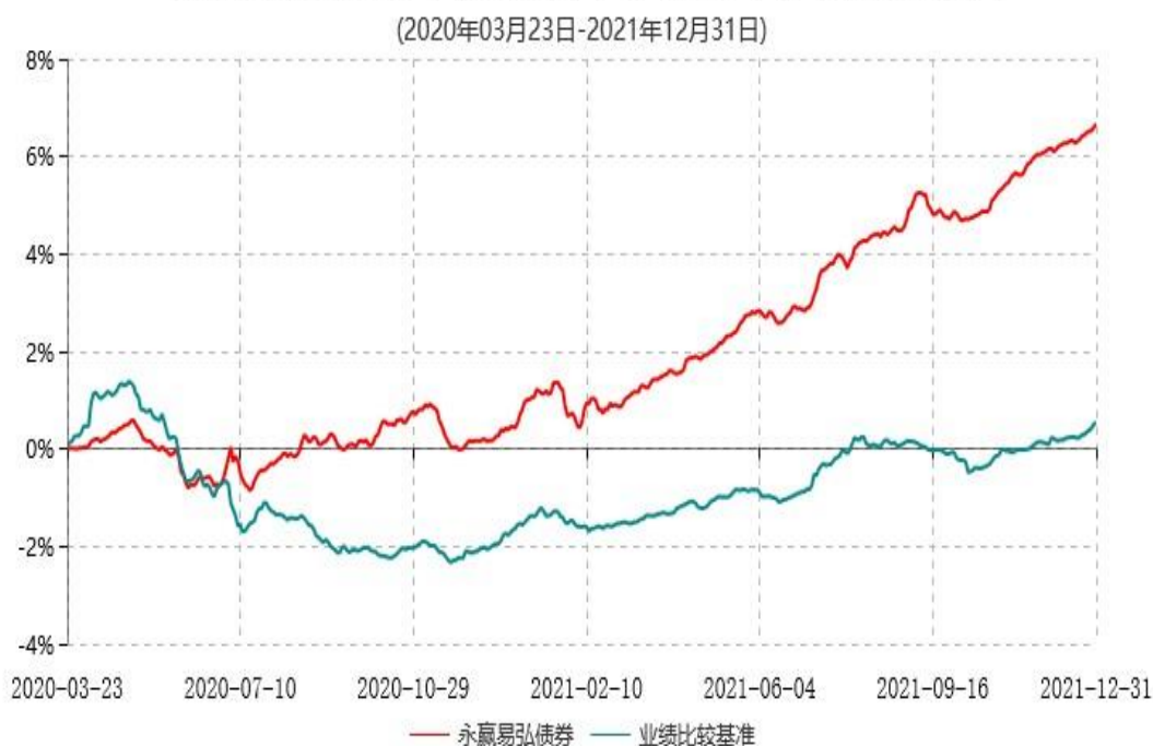
永赢易弘债券型证券投资基金累计净值增长率与业绩比较基准收益率历史走势对比图