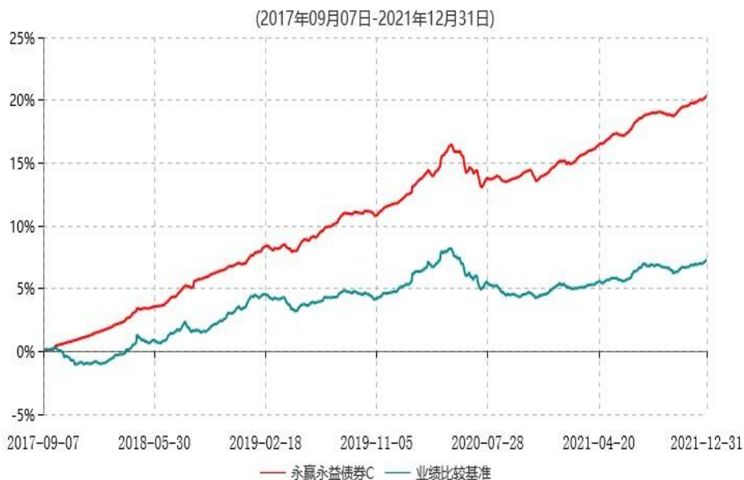
永赢永益债券C累计净值增长率与业绩比较基准收益率历史走势对比图