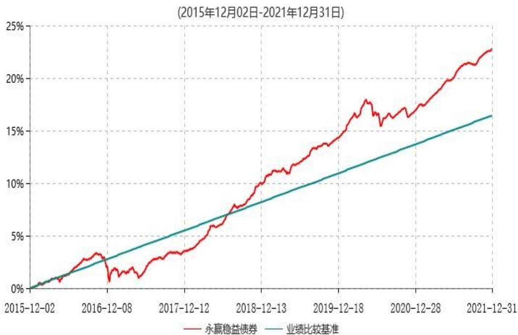
永赢稳益债券型证券投资基金累计净值增长率与业绩比较基准收益率历史走势对比图