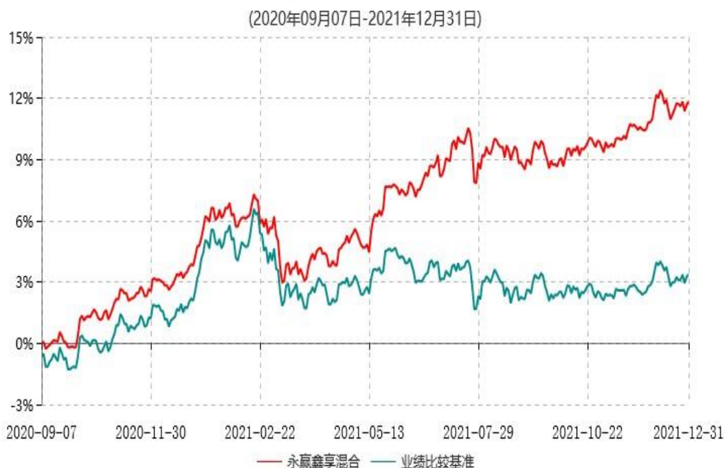
永赢鑫享混合型证券投资基金累计净值增长率与业绩比较基准收益率历史走势对比图