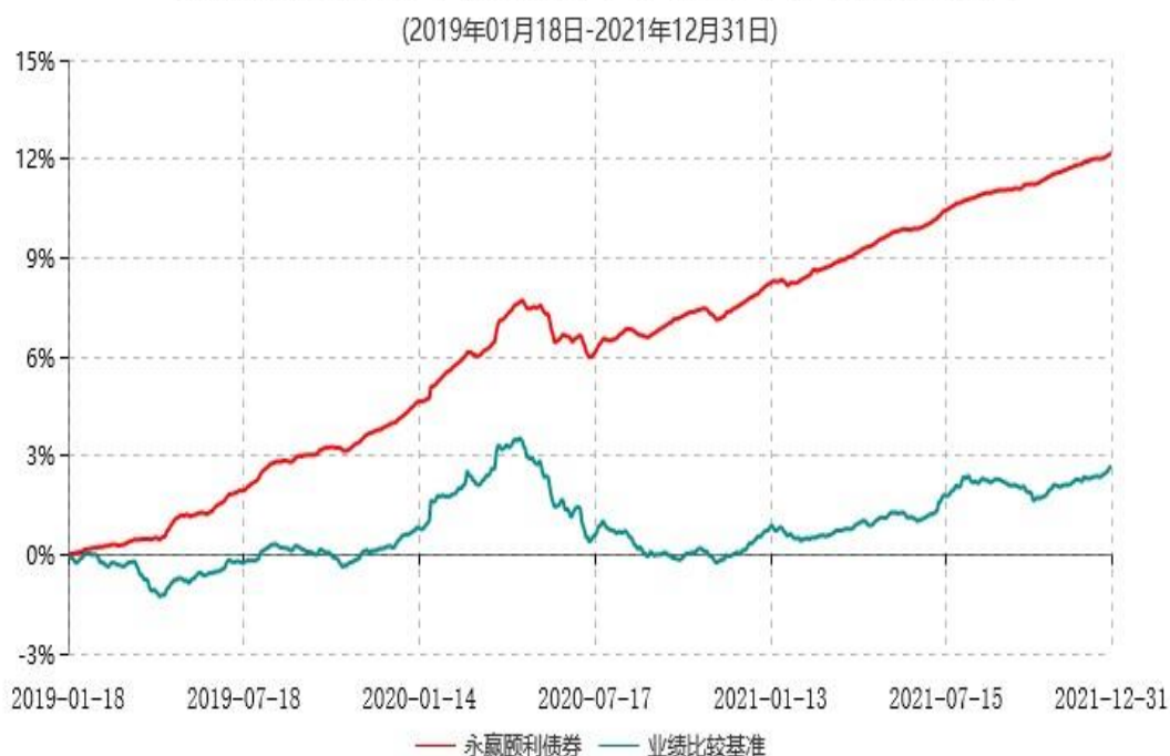
永赢颐利债券型证券投资基金累计净值增长率与业绩比较基准收益率历史走势对比图