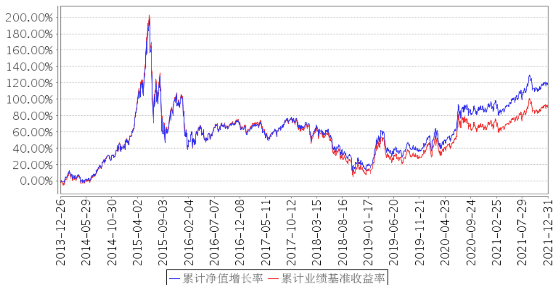
景顺长城中证500ETF累计净值增长率与同期业绩比较基准收益率的历史走势对比图

注：本基金的投资组合比例为：本基金投资范围主要为标的指数成份股及备选成份股，投资于标的指数成份股及备选成份股的比例不低于基金资产净值的 90%，且不低于非现金基金资产的 80%。本基金的建仓期为自 2013 年 12 月 26 日基金合同生效日起 6 个月。建仓期结束时，本基金投资组合达到上述投资组合比例的要求。