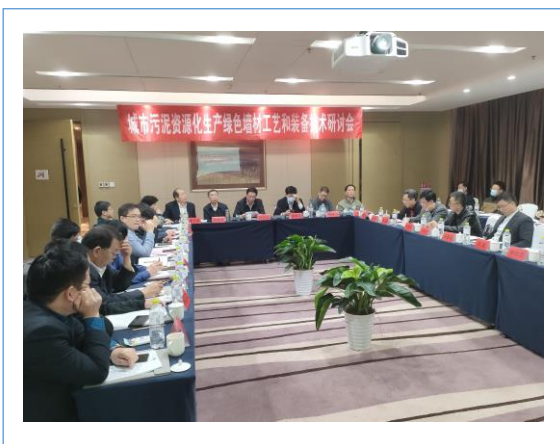
2021 年 10 月 23 日聚祥公司邀请了省工信厅、中国砖瓦工业协会和高校的 27 名专家和学者，在济南召开“城市污泥资源化生产绿色墙材工艺和装备技术研讨会”。