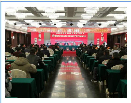
2021 年 1 月 8 日，公司召开第八届新技术新装备推介会。