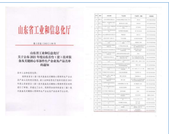
2021 年 9 月，公司研发的“全自动卸砖打包系统”被认定为 2021 年度山东省首台（套）技术装备。