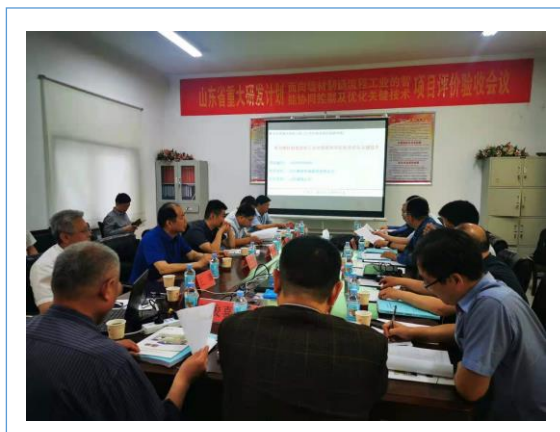
2021 年 5 月 22 日，山东省重大科技创新工程项目《面向墙材制造流程工业的智能协同控制及优化关键技术》通过省科技厅专家验收。