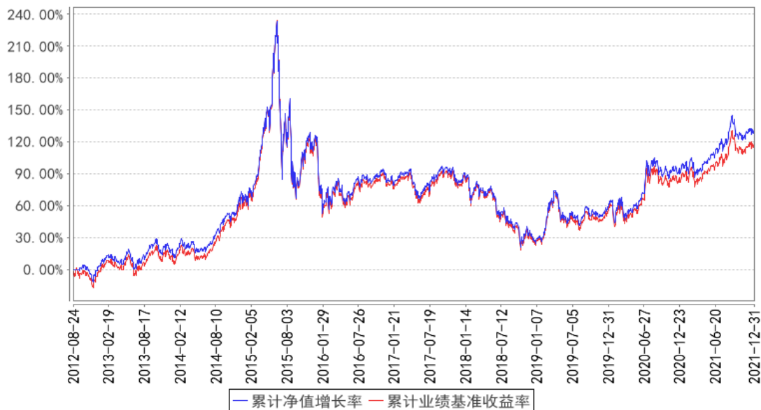
中证500沪市ETF累计净值增长率与同期业绩比较基准收益率的历史走势对比图

注：本基金合同规定，基金管理人应当自基金合同生效之日起六个月内使基金的投资组合比例符合基金合同的约定。建仓期结束时，本基金的投资组合比例符合基金合同的约定。