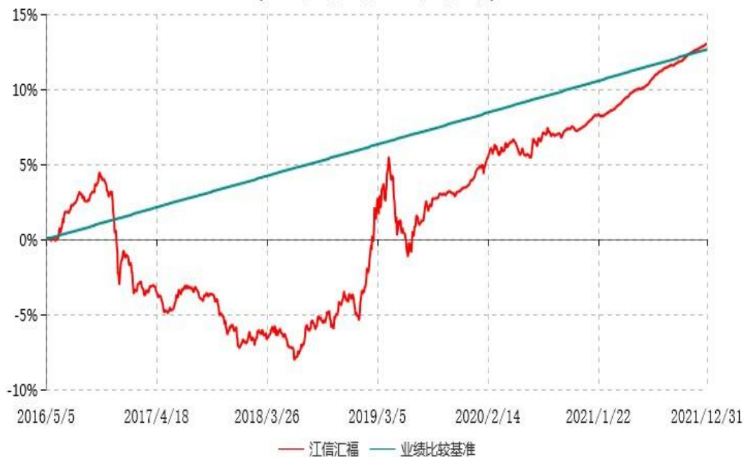
江信汇福定期开放债券型证券投资基金累计净值增长率与业绩比较基准收益率历史走势对比图 (2016年05月05日-2021年12月31日)