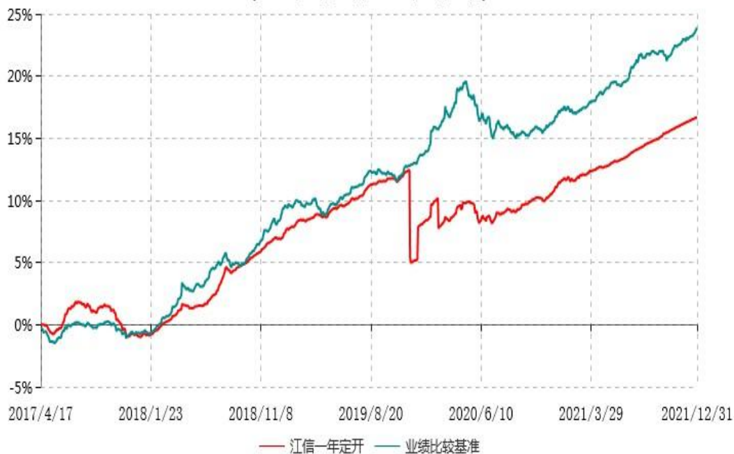
江信一年定期开放债券型证券投资基金累计净值增长率与业绩比较基准收益率历史走势对比图 (2017年04月17日-2021年12月31日)