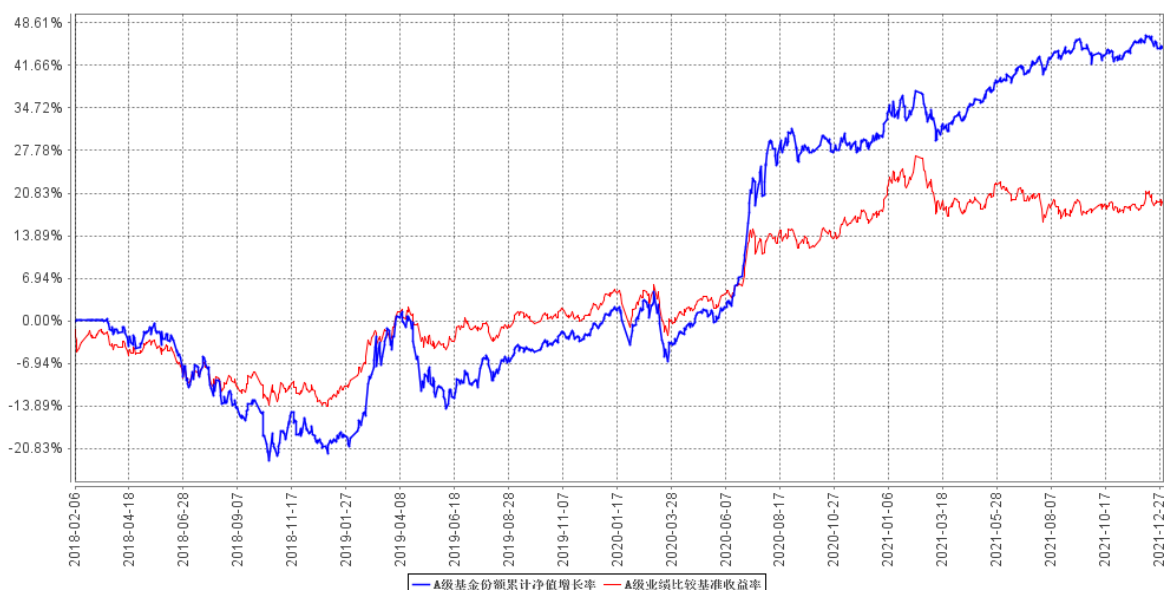
B级基金份额累计净值增长率与同期业绩比较基准收益率的历史走势对比图