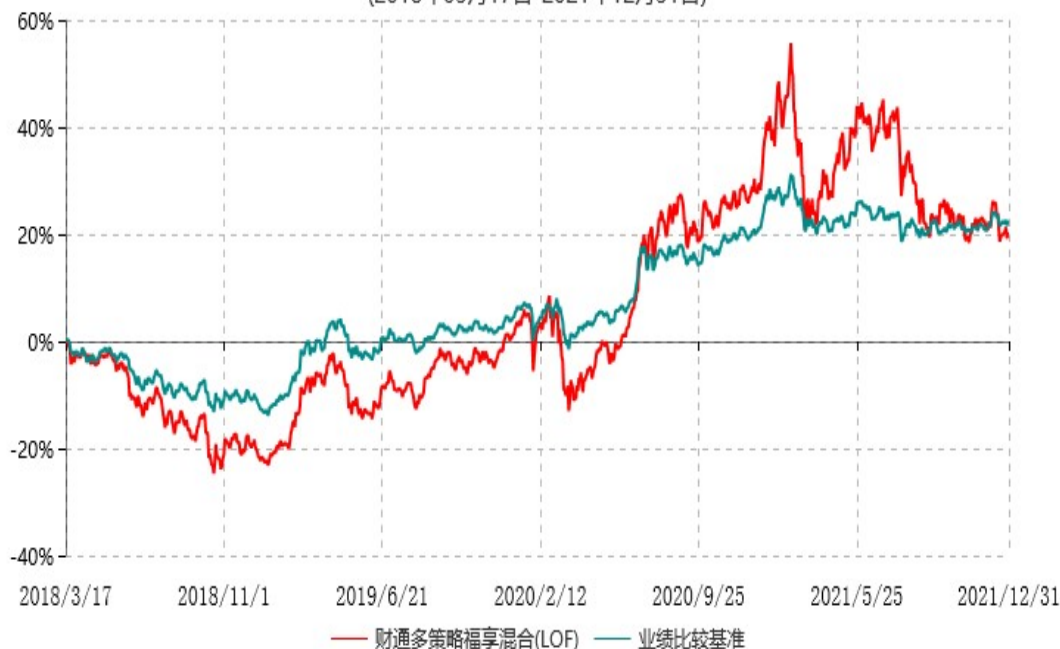
财通多策略福享混合型证券投资基金(LOF)累计净值增长率与业绩比较基准收益率历史走势对比图 (2018年03月17日-2021年12月31日)

注：(1)本基金合同生效日为2016年9月18日，转型日期为2018年3月17日；