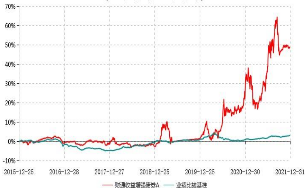
财通收益增强债券A累计净值增长率与业绩比较基准收益率历史走势对比图 (2015年12月25日-2021年12月31日)