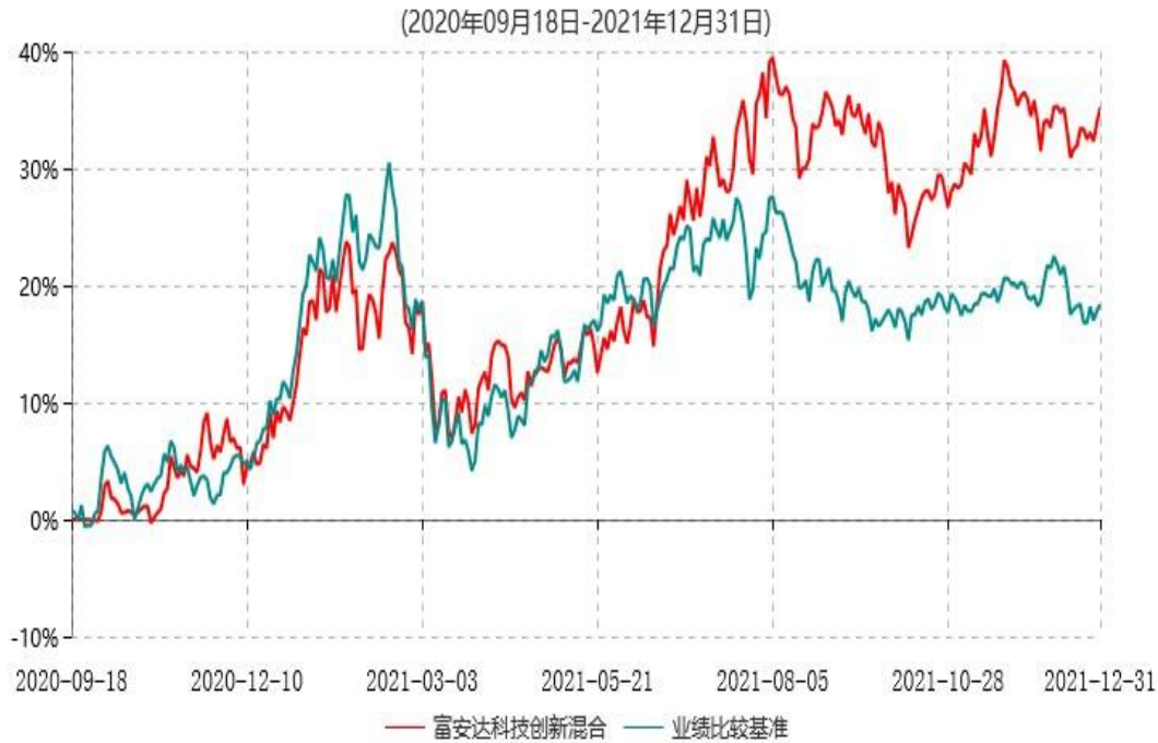
富安达科技创新混合型发起式证券投资基金累计净值增长率与业绩比较基准收益率历史走势对比图

注：根据本基金《基金合同》规定，本基金建仓期为6个月，建仓截止日为2021年3月17日。建仓期结束时本基金各项资产配置比例符合本基金合同规定的比例限制及投资组合的比例范围。