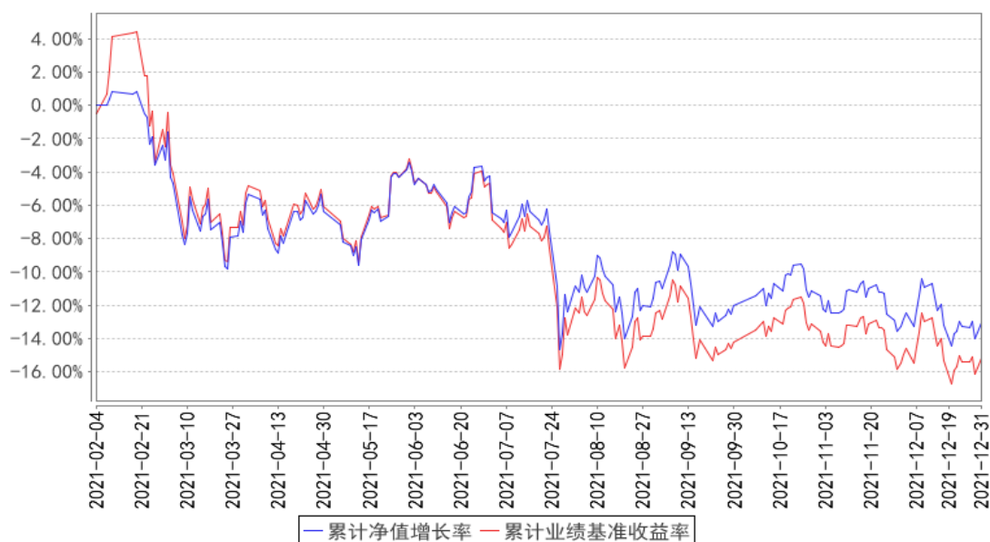
沪港深累计净值增长率与同期业绩比较基准收益率的历史走势对比图

注：本基金合同生效日期为 2021 年 02 月 04 日，自基金合同生效日起到本报告期末不满一年，按