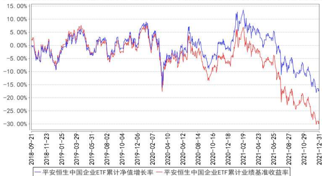
平安恒生中国企业ETF累计净值增长率与同期业绩比较基准收益率的历史走势对比图