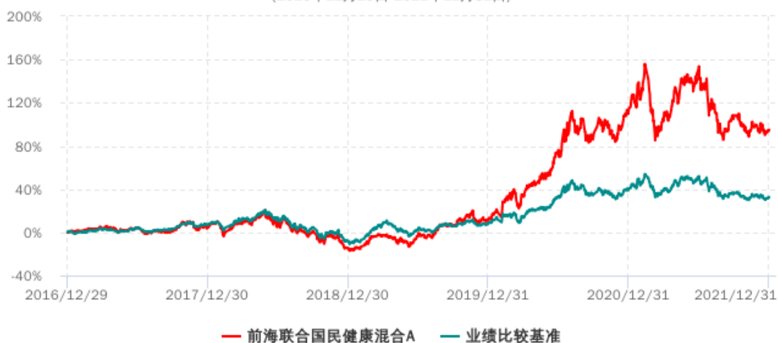
前海联合国民健康混合A累计净值增长率与业绩比较基准收益率历史走势对比图 (2016年12月29日-2021年12月31日)