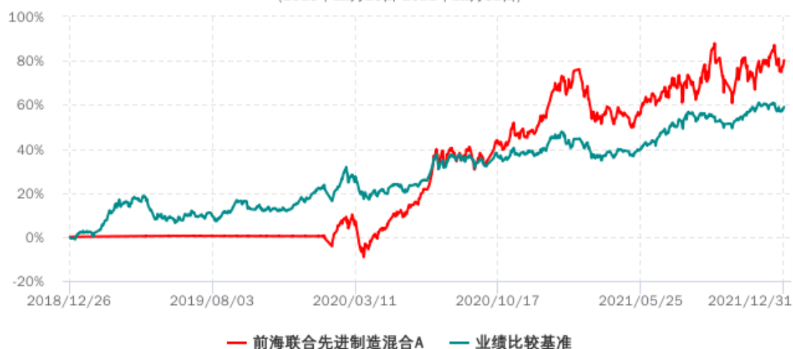
前海联合先进制造混合C累计净值增长率与业绩比较基准收益率历史走势对比图