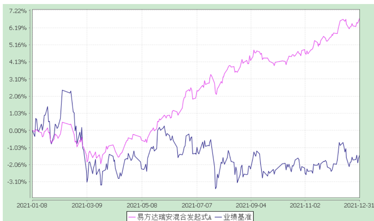
易方达瑞安混合发起式 C