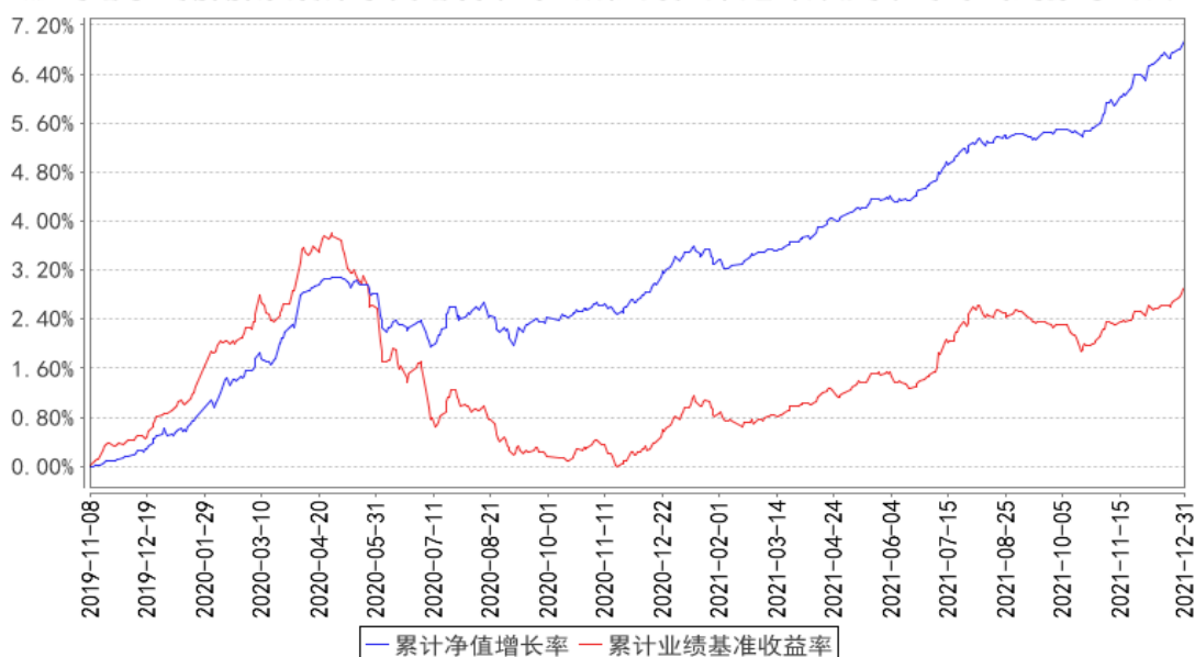
融通增享纯债债券累计净值增长率与同期业绩比较基准收益率的历史走势对比图