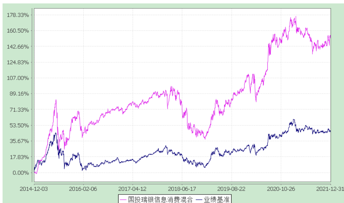
国投瑞银信息消费灵活配置混合型证券投资基金 份额累计净值增长率与业绩比较基准收益率的历史走势对比图 (2014 年 12 月 3 日至 2021 年 12 月 31 日)

注：本基金建仓期为自基金合同生效日起的 6 个月。截至建仓期结束，本基金各项资产配置比例符合基金合同及招募说明书有关投资比例的约定。