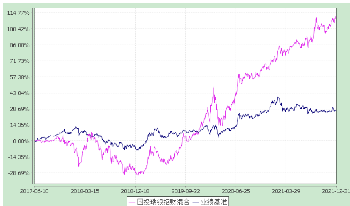
国投瑞银招财灵活配置混合型证券投资基金 份额累计净值增长率与业绩比较基准收益率的历史走势对比图 (2017 年 6 月 10 日至 2021 年 12 月 31 日)

注：本基金建仓期为自基金转型日起的六个月。截至建仓期结束，本基金各项资产配置比例符合基金合同及招募说明书有关投资比例的约定。