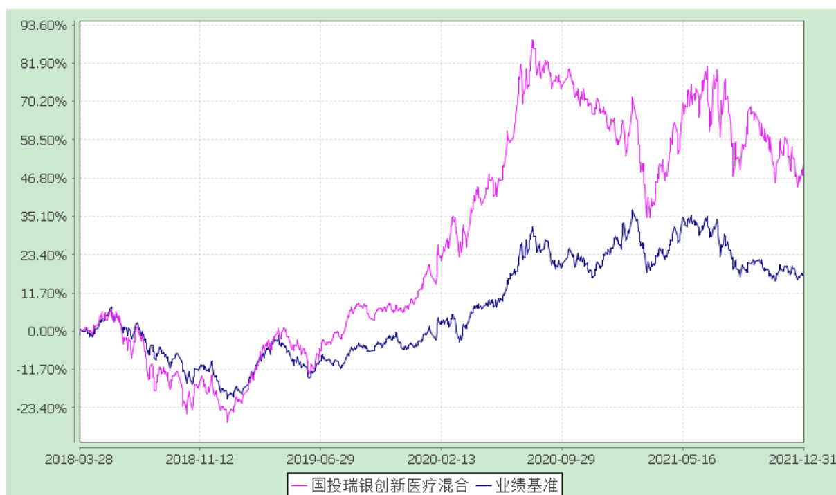
国投瑞银创新医疗灵活配置混合型证券投资基金 份额累计净值增长率与业绩比较基准收益率的历史走势对比图 (2018 年 3 月 28 日至 2021 年 12 月 31 日)

注：本基金建仓期为自基金合同生效日起的 6 个月。截至建仓期结束，本基金各项资产配置比例符合基金合同及招募说明书有关投资比例的约定。