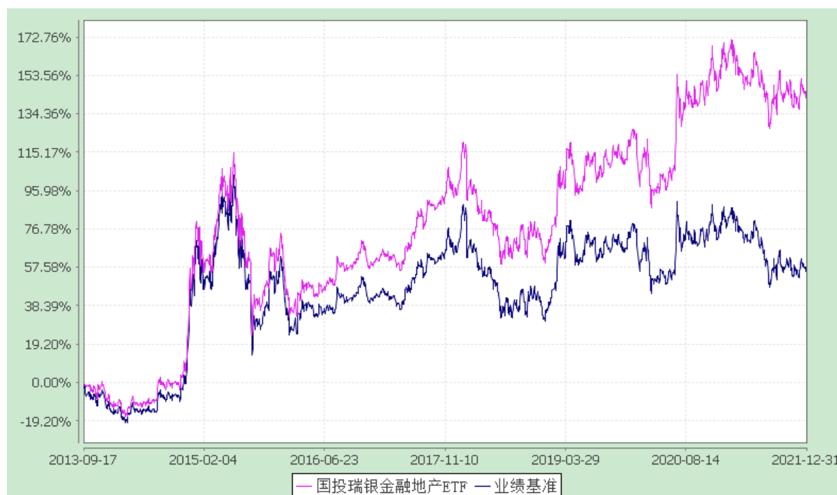
份额累计净值增长率与业绩比较基准收益率的历史走势对比图 (2013 年 9 月 17 日至 2021 年 12 月 31 日)

注：本基金建仓期为自基金合同生效日起的 3 个月。截至建仓期结束，本基金各项资产配置比例符合基金合同及招募说明书有关投资比例的约定。