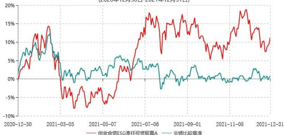
创金合信 ESG 责任投资股票 A 累计净值增长率与业绩比较基准收益率历史走势对比图 (2020年12月30日-2021年12月31日)