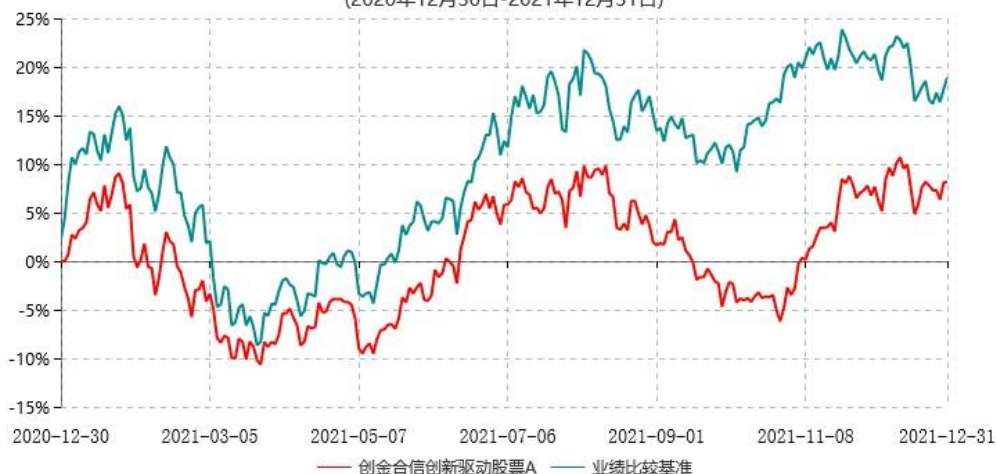
创金合信创新驱动股票A累计净值增长率与业绩比较基准收益率历史走势对比图 (2020年12月30日-2021年12月31日)