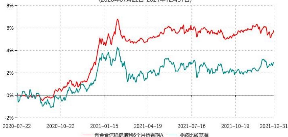
创金合信稳健增利6个月持有期A累计净值增长率与业绩比较基准收益率历史走势对比图 (2020年07月22日-2021年12月31日)