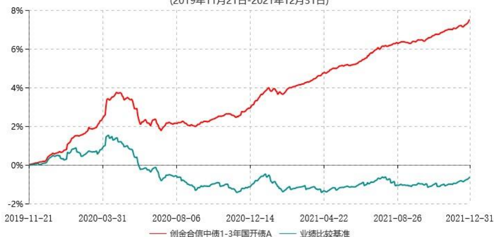
创金合信中债1-3年国开债A累计净值增长率与业绩比较基准收益率历史走势对比图 (2019年11月21日-2021年12月31日)