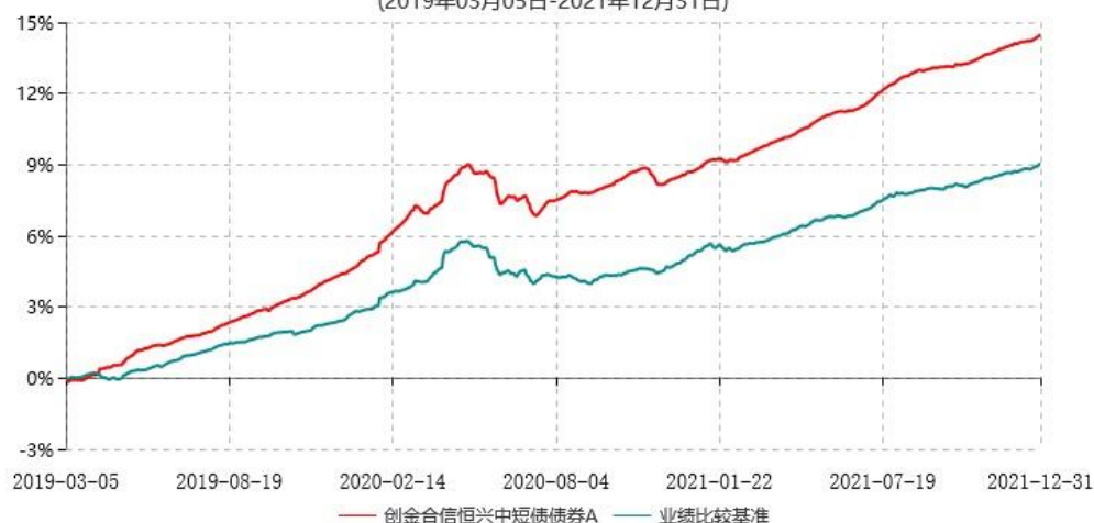
创金合信恒兴中短债债券A累计净值增长率与业绩比较基准收益率历史走势对比图 (2019年03月05日-2021年12月31日)