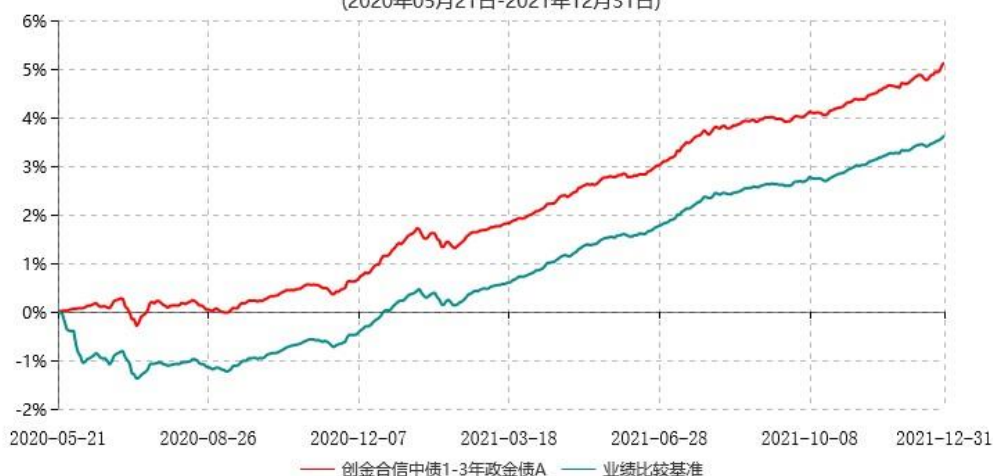
创金合信中债1-3年政金债A累计净值增长率与业绩比较基准收益率历史走势对比图 (2020年05月21日-2021年12月31日)