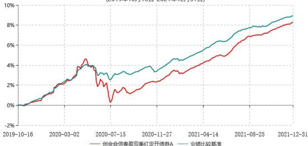
创金合信泰盈双季红定开债券A累计净值增长率与业绩比较基准收益率历史走势对比图 (2019年10月16日-2021年12月31日)