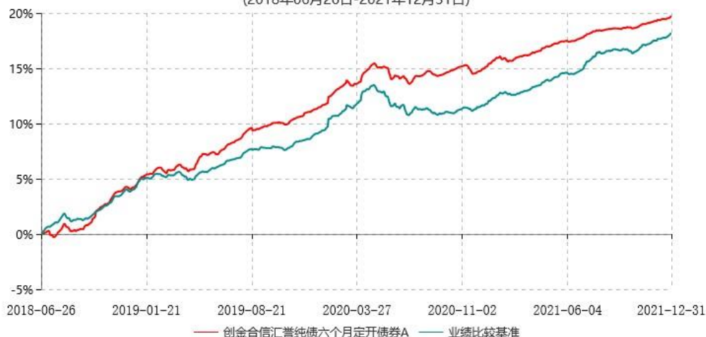
创金合信汇誉纯债六个月定开债券A累计净值增长率与业绩比较基准收益率历史走势对比图 (2018年06月26日-2021年12月31日)