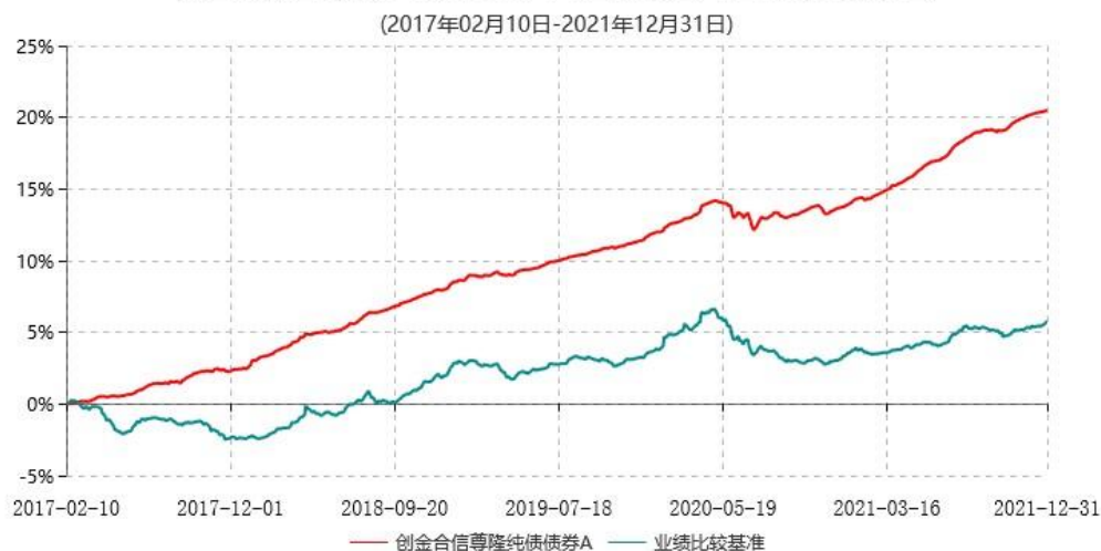
创金合信尊隆纯债债券A累计净值增长率与业绩比较基准收益率历史走势对比图