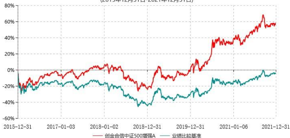
创金合信中证500增强C累计净值增长率与业绩比较基准收益率历史走势对比图