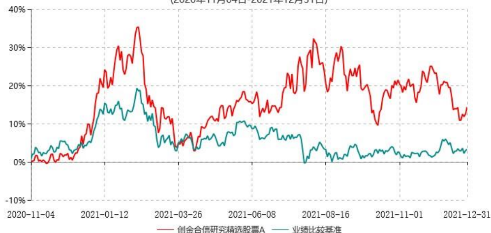
创金合信研究精选股票A累计净值增长率与业绩比较基准收益率历史走势对比图 (2020年11月04日-2021年12月31日)