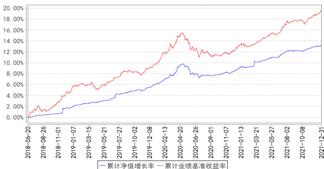
鹏华尊享定期开放发起式债券累计净值增长率与同期业绩比较基准收益率的历史走势对比图

注：1、本基金基金合同于 2018 年 06 月 20 日生效。2、截至建仓期结束，本基金的各项投资比例已达到基金合同中规定的各项比例。