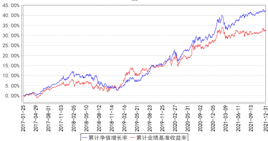
鹏华兴惠定期开放混合累计净值增长率与同期业绩比较基准收益率的历史走势对比图

注：1、本基金基金合同于 2017 年 01 月 25 日生效。2、截至建仓期结束，本基金的各项投资比例已达到基金合同中规定的各项比例。