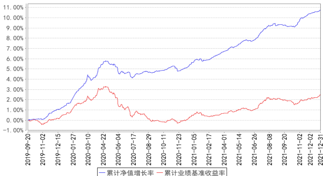
丰鑫债券累计净值增长率与同期业绩比较基准收益率的历史走势对比图

注：1、本基金基金合同于 2019 年 09 月 20 日生效。2、截至建仓期结束，本基金的各项投资比例已达到基金合同中规定的各项比例。